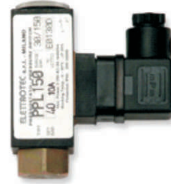
PML & PPL basınç şalterleri