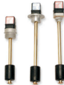
LM2CTA200 LM2CTA 300